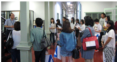
オープンキャンパス・豊橋（大学記念館にて）