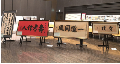
「東亜同文書院から愛知大学へ」 （岡崎展示会・講演会にて）

2006（平成18）年から毎年、全国各地（米国シカゴを含む）で展示会・講演会を18回開催している。大学記念館に所蔵している史資料コレクションの展示と、東亜同文書院、愛知大学史に関わるパネルや資料などを展示公開。併せて「東亜同文書院45年＋愛知大学」をべー