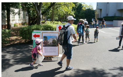
JR東海さわやかウォーキング (大学記念館前にて)

学ならではのコレクションを見ていただける良い機会として歓迎している。「地方創生」「地元への還元」の一環として、地域と本学がwin x winの関係を構築できる喜びを感じざるを得ない。