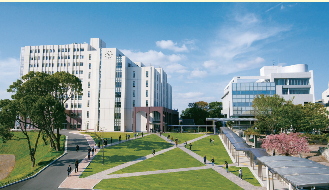
創立90周年記念事業の一環として整備された御井キャンパスのシンボルとなる御井本館(左奥)(久留米大学)