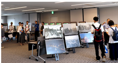
オープンキャンパス・名古屋（本館20階にて）

スに、開催地との関わりなど研究を公開する講演会を開催している。2018年度は、愛知県岡崎市において6月29日～7月1日に「上海と東亜同文書院大学・愛知大学」と題して開催し、来館者は300名を数えた。なお、18回までの開催地は図のとおりである。 ② オープンキャンパスでの「大学記念館」開放（豊橋校舎）と出張展示（名古屋校舎） 本学の特徴の一つとして、東亜同文書院大学から愛知大学への経緯、および愛知大学創設時に掲げられた設立の趣意の内容とその意義などを、高校生に直接伝えていく。史資料コレクションやパネルを利用した簡単なギャ