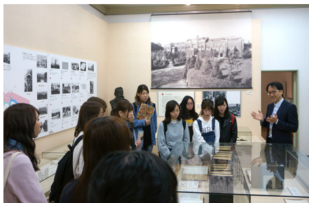
「基礎演習」(大学記念館、常設展にて)

し、毎回感想文の提出とともに、講義終了時に関連ペー ジを学生に伝え、翌週までに復習を課題とした。 なお、講義内容は、72年間の愛知大学史だけでなく、 45年間のルーツ校・東亜同文書院とのつながり、さらに 東亜同文書院の創立にいたるそれ以前のグローバル教育 の変遷までも含んでいる。