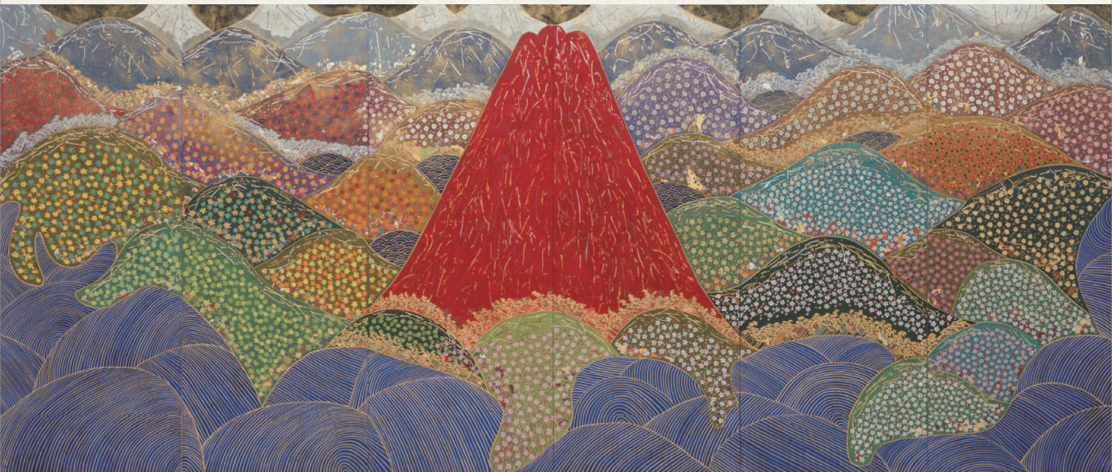
平松礼二「東海富士図」2006年 町立湯河原美術館蔵