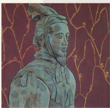
將軍俑(中国) 15号変 (2008)