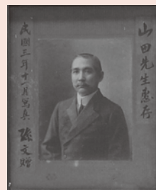
孫文が山田純三郎に贈った肖像写真