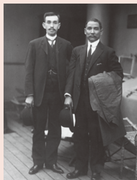
山田純三郎(左)と孫文