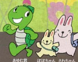
あゆむ君 ぼぼちゃん さわちゃん

さわやかウォーキングの情報はホームページでもご覧になれます。 さわやかウォーキングホームページ http://walking.jr-central.co.jp