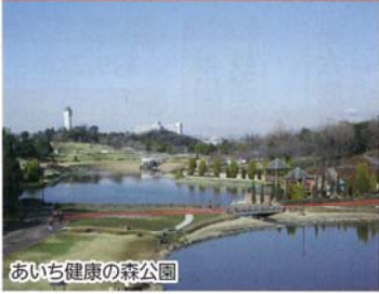
あいち健康の森公園